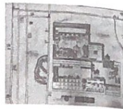
图1 梳理分析“布”资源的价值 图2 “布”资源地图